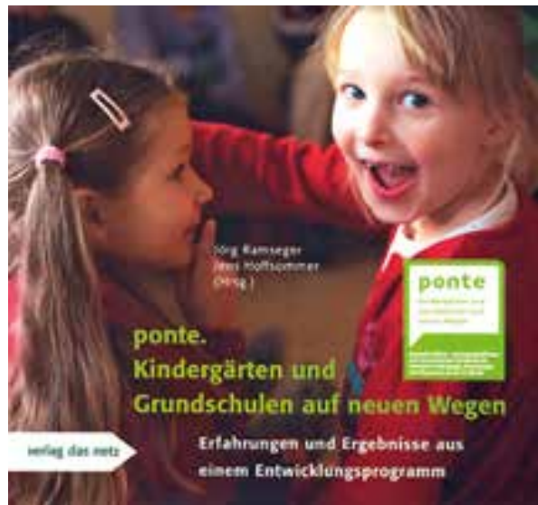
2008: Bericht über das Forschungsprojekt der Bildungspartnerschaft von Kita und Grundschulen | 2011: Bericht über das Forschungsprojekt »naturwissenschaftliche Forschung der Kinder« (Hg.: Deutsche Telekom-Stiftung und Deutsche Kinder- und Jugendstiftung)

Ramseger folgert aus den Beobachtungen von Kindern: »Von »Vorläuferfähigkeiten« zu sprechen macht nur Sinn, wo Kinder in Kindergarten und Vorschule daran gehindert werden, in Bezug auf die Schrift weiter reichende Lernerfahrungen zu machen, in der Annahme, das »eigentliche« Lernen würde erst in der Schule beginnen.