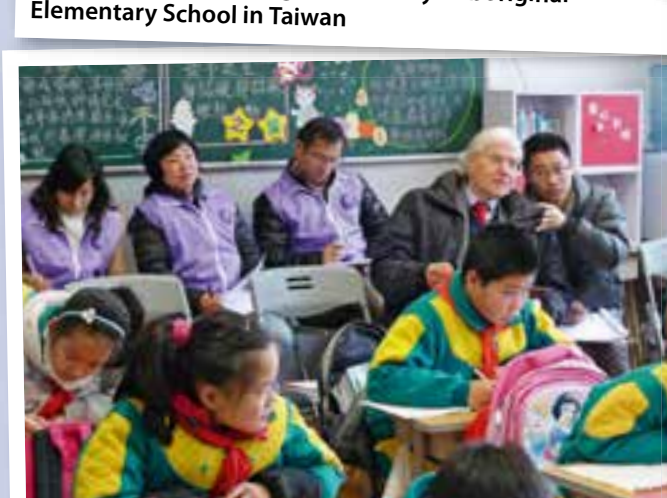
Schulbesuch in Shanghai 2014