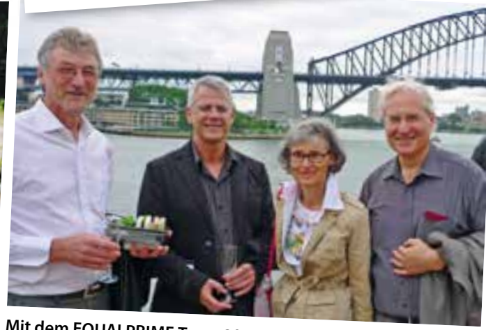
Mit dem EQUALPRIME Team 2012 in Sydney