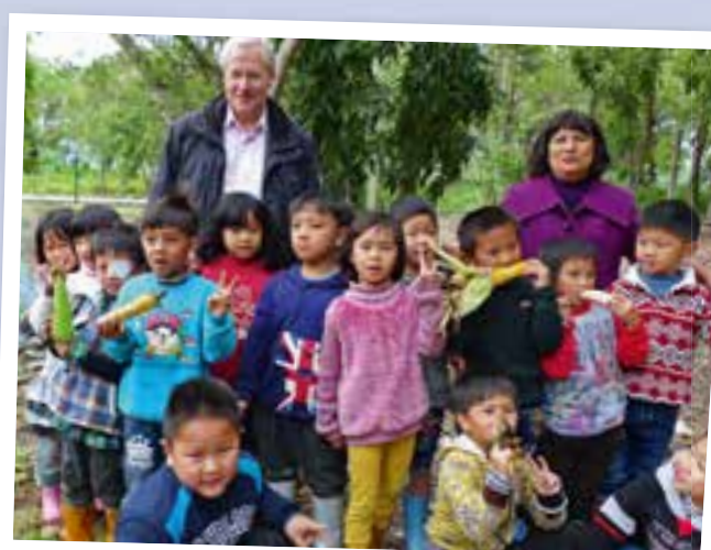
2014: Outdoor-Pädagogik an der Luye Aboriginal Elementary School in Taiwan