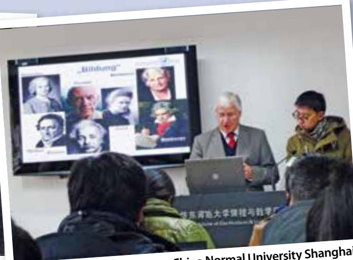
2014: Gastvortrag an der East China Normal University Shanghai