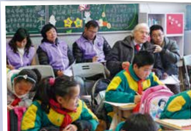
Schulbesuch in Shanghai 2014