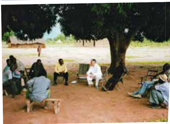
2001: Lehrerfortbildung unter Bäumen im Tschad