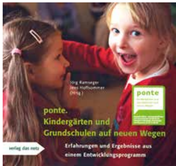
2008: Bericht über das Forschungsprojekt der Bildungspartnerschaft von Kita und Grundschulen | 2011: Bericht über das Forschungsprojekt »naturwissenschaftliche Forschung der Kinder« (Hg.: Deutsche Telekom-Stiftung und Deutsche Kinder- und Jugendstiftung)