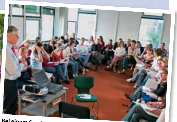
Bei einem Seminar an der FU Berlin 2004