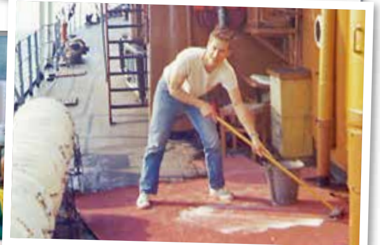
... und 1968 als Schiffsjunge auf dem Forschungsschiff Gauss