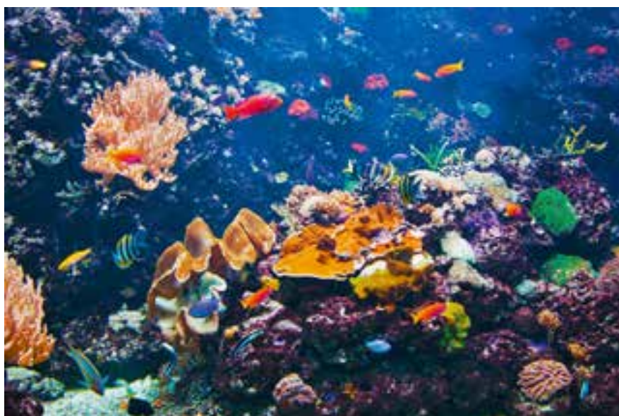
Die Vielfalt des Korallenriffs als Sinnbild für Inklusion. Nach einer Idee von Annedore Prengel

Zur Geschichte der Grundschule gehört leider auch die schon mit dem Weimarer Kompromiss verbundene Ausgrenzung der Kinder mit Behin-