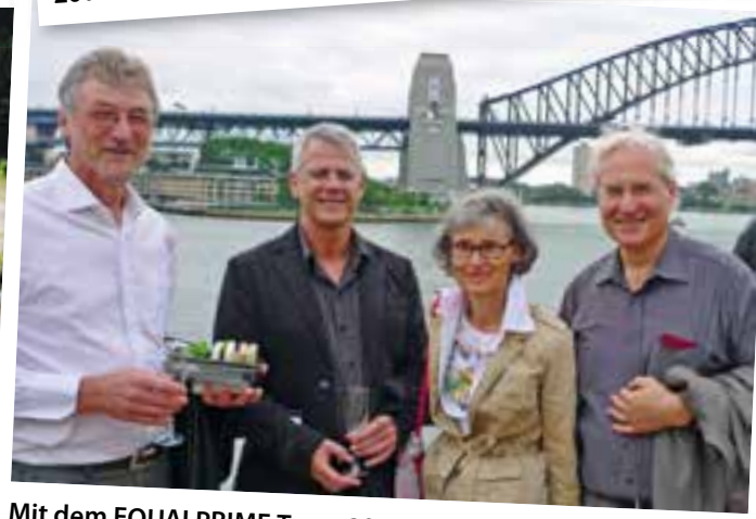
Mit dem EQUALPRIME Team 2012 in Sydney