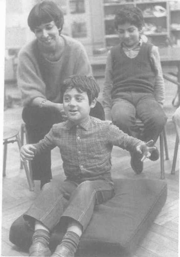
Abb. 2: “. . . da war ein Krokodil, und ich habe mein Messer genommen und mit dem Krokodil gekämpft und ich habe es getötet.”