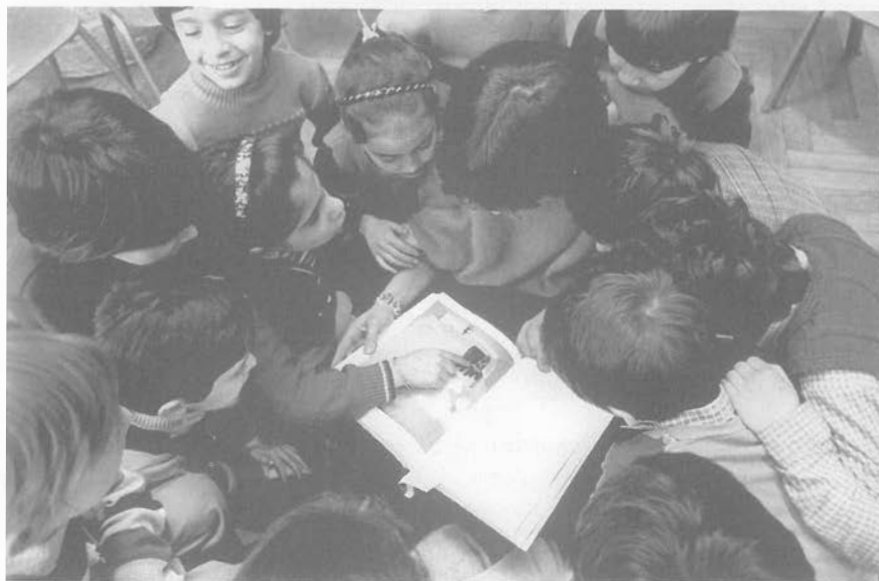
Abb. 5: "So was mit einem Riesengespenst, das habe ich auch mal geträumt. Das sah genau so aus."