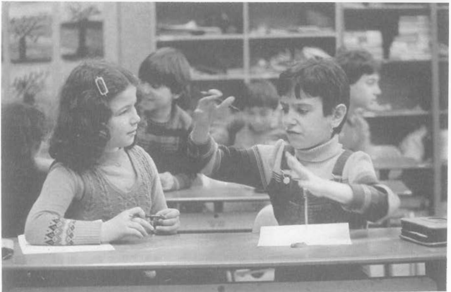
Abb. 7: "Ich war einmal in einem Schrank, und da war noch eine Tür, und da war auf einmal eine Straße und noch eine Tür . . .".