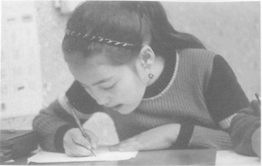
Abb. 6: "Einmal fiel mir ein Zahn aus und dann kamen alle anderen Zähne auch raus, und dann bin ich zum Doktor gegangen."