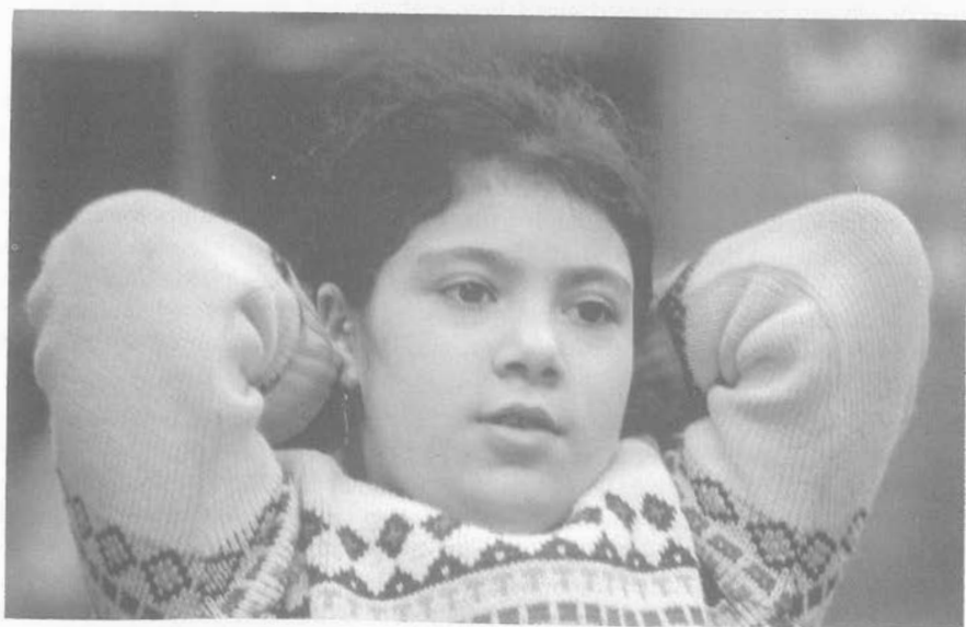
Abb. 3: “Einmal habe ich geträumt, ich gehe und gehe, da habe ich einen Berg gesehen . . .”