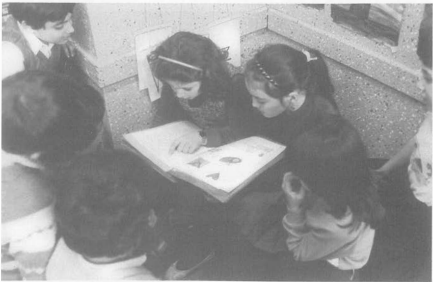
Abb. 9: "Das habe ich geschrieben: 'Ich wünsche mir...'"