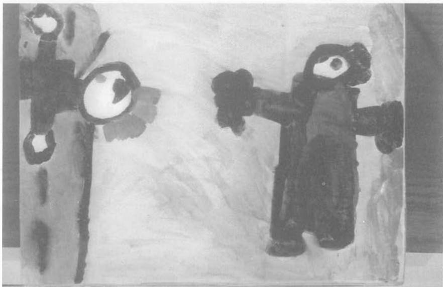
Abb. 8: "Einmal habe ich geträumt, ich kann fliegen, weil ich Angst vor den Punkern hatte. Dann bin ich aufgewacht."