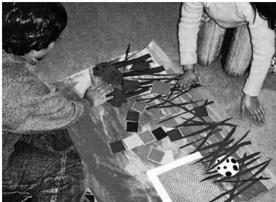
Die Animation wird vorbereitet