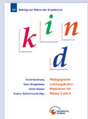
Band 121 5 Hefte im Schuber / mit CD ISBN 3-930024-94-2 Best.-Nr. 1079 17,- €