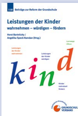
Band 118 ISBN 3-930024-87-X Best.-Nr. 1076 17,- €