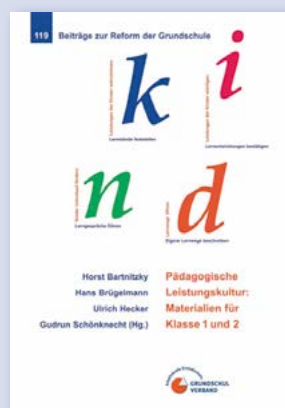
Band 119 5 Hefte im Schuber / mit CD ISBN 3-930024-88-8 Best.-Nr. 1077 17,- €