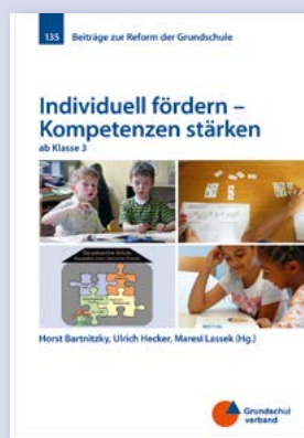
Band 135 4 Hefte im Schuber / mit CD ISBN 978-3-941649-08-8 Best.-Nr. 1095 19,50 €

Bestellungen über die Geschäftsstelle oder online: www.grundschulverband.de > Veröffentlichungen > Mitgliederbände