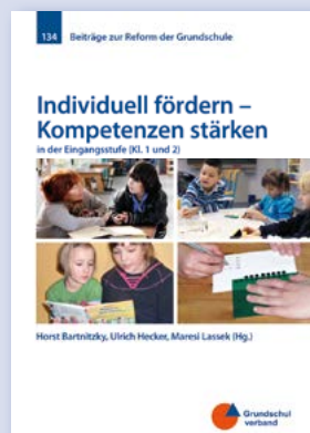
Band 134 4 Hefte im Schuber / mit CD ISBN 978-3-941649-05-7 Best.-Nr. 1092 19,50 €