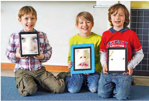
Abb. 3: Lernen mit neuen Medien kann neue Perspektiven auf die Welt und die eigene Person eröffnen