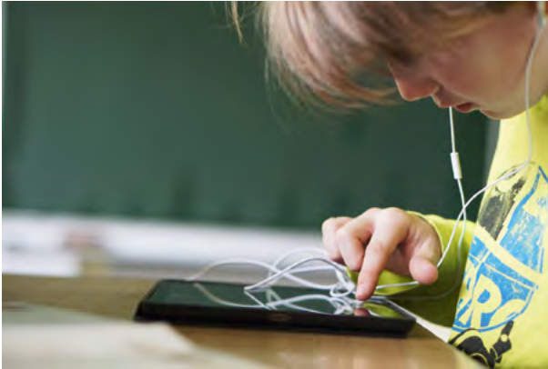
Abb. 2: Medium und Nutzer stehen in einem Interaktionsverhältnis

Im Folgenden soll auf der Basis des Interaktionsparadigmas das Spektrum möglicher medienpädagogischer Grundrichtungen dargestellt werden.