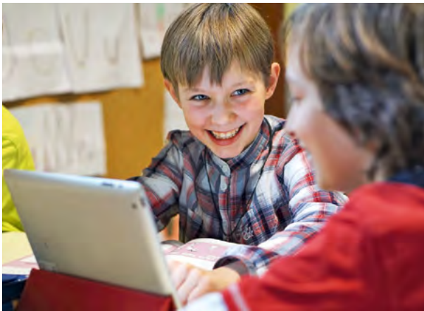
Abb. 4: Innovative Lernkonzepte mit digitalen Medien benötigen Technologien, die sich in moderne Unterrichtsszenarien und Kommunikationsprozesse einfügen, statt diese zu dominieren

dernden Gefahren für den Grundschulunterricht etwa aufgrund der Verdrängung von Sozial- und Primärerfahrungen durch eine vermehrte Computernutzung gewarnt. Rückblickend wird deutlich, dass sowohl Erwartungen als auch Befürchtungen bei der Einführung digitaler Medien zu Beginn zu extrem ausfielen. So kann konstatiert werden, dass bspw. Interaktive Whiteboards den Grundschulunterricht bei Weitem nicht so dramatisch verändert haben, wie von Kritikern befürchtet oder Anhängern versprochen wurde (Irion 2012).