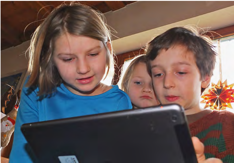
Abb. 1: Kinder im Grundschulalter haben ein hohes Interesse an digitalen Medien

dass Bücher nur lehren, von dem zu reden, was man nicht weiß (Rousseau 1762/2012). Das Kino wurde zu Beginn des letzten Jahrhunderts als Gefahr für die Seele vor allem Heranwachsender betrachtet (Gaupp 1911/12) und auch das Massenmedium Fernsehen wurde zu Beginn so kritisch beäugt, dass beispielsweise die Sesamstraße von einigen Rundfunksendern boykottiert wurde. 2